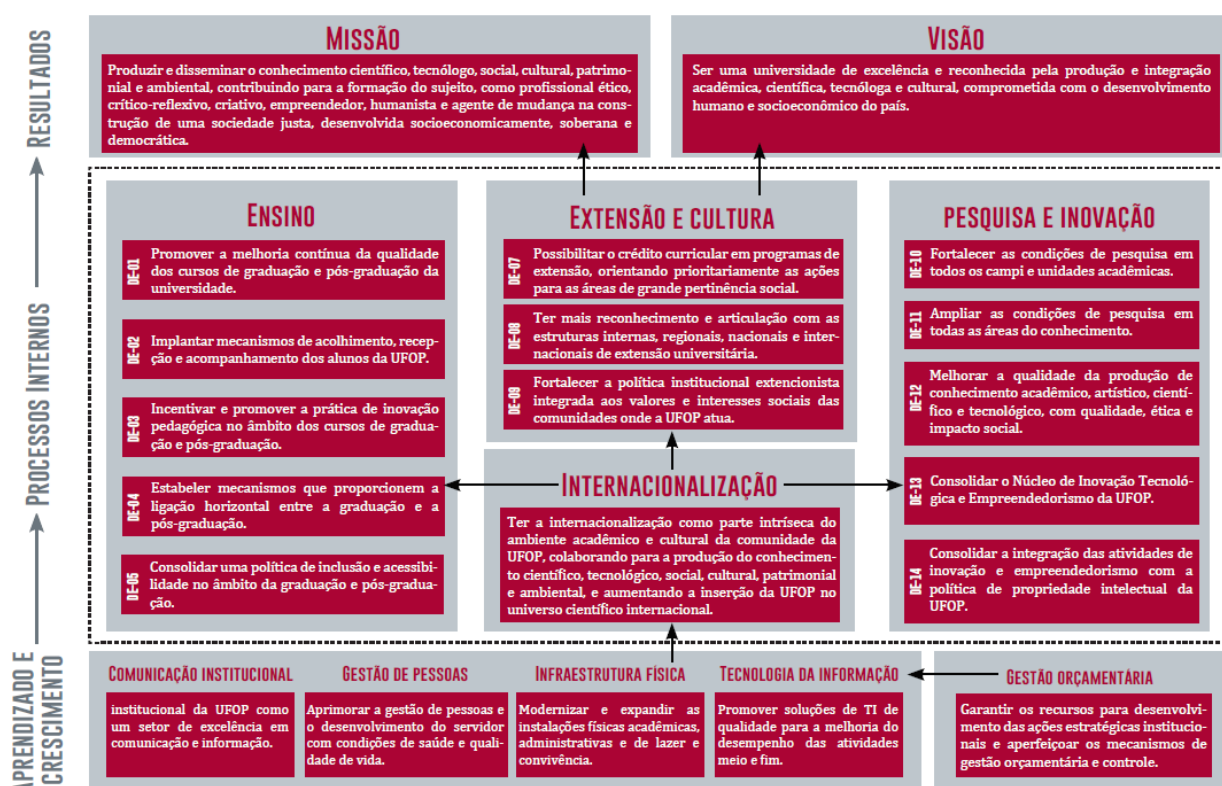
Figura 08: Mapa Estratégico da UFOP